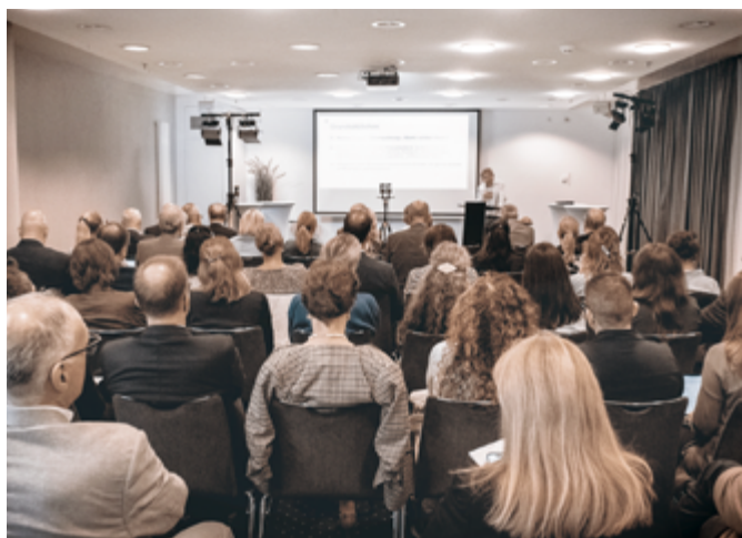
Cercle de qualité SLH

L'ASSOCIATION THE SWISS LEADING HOSPITALS (SLH) TIENT COMPTE DE CETTE TENDANCE EN PROPOSANT À SES MEMBRES DES PRESTATIONS NETTEMENT PLUS ÉTENDUE.